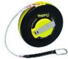
SPORTOVNÍ SVINOVACÍ PÁSMO