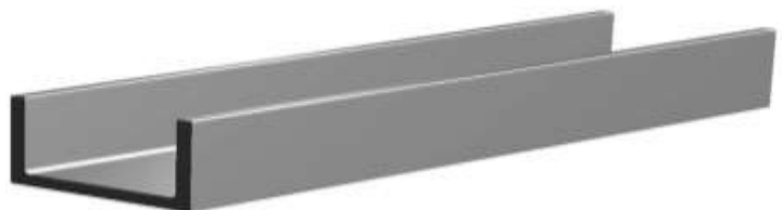
ŽELEZNÝ PROFIL – TRAVERZA