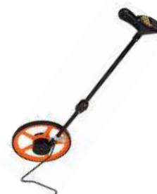
KOLEČKO NA MĚŘENÍ DRÁHY