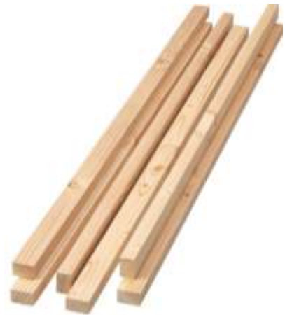
DŘEVO - HRANOLY