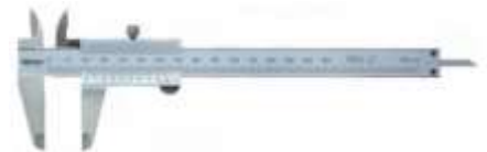
POSUVNÉ MĚŘIDLO - ŠUPLERA