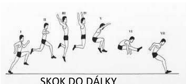
SKOK DO DÁLKY